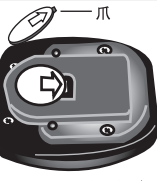
電池AG-13 (LR44) ボタン電池1個

■電池の交換 付属の電池はモニター用です。新品の電池への交換を早めに行ってください ■交換方法 左図のように本体の裏面には一があります。そのミゾにマイナスドライバーをテコの要領でフタが開きます。フタは固定されていません紛失しないように気をつけてください。浅く差し込み開けると爪が折れます。その場合センサー選しなどで開けてください。交換後はフタを真っ直ぐに合わせて強く押し「パチッ」音がすれば完了です。